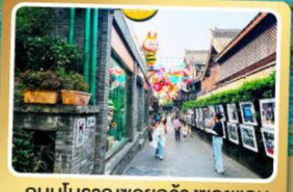
ถนนโบราณชอยกวางชอยแคบ