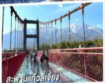
สะพานแก้วลี่เจียง