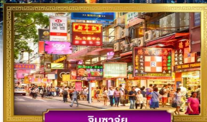
จิมซาจุ่ย