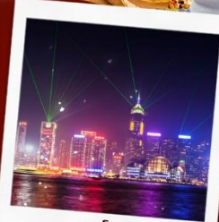
ชมโชว์ SYMPHONY OF LIGHT