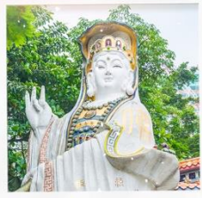
เจ้าแม่กวนอิมรพัสเบย์