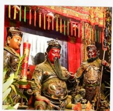
เทพเจ้ากวนอู วัดกวนไท