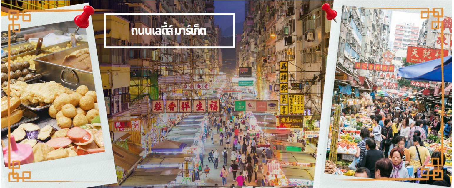
ถนนเลดี้ส์ มาร์เก็ต

การเดินทางที่ชิบูย่าเลยก็ว่าได้ และยังมี ถนนเลดี้ส์ มาร์เก็ต (LADIES MARKET) ที่มีทั้งเครื่องสำอาง เสื้อผ้า รองเท้า กระเป๋า เครื่องประดับมากมายให้เลือกช้อป อีกทั้งยังมีร้านอาหารและเครื่องดื่ม ที่ขึ้นชื่อหลากหลายชนิด ให้ทุกท่านได้ลองลิ้มรสอีกมากมาย