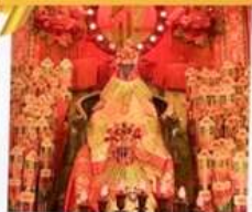
เจ้าแม่กวนอิมสองอ้า

โรงแรม Eaton Hotel และ iclub Mong Kok Hotel