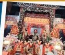
เทพเจ้ากวนอู วัดกวนไท่