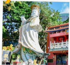
เจ้าแม่กวนอิมรพัสสนีย์

23 กุมภาพันธ์ 2568 วันยืมเงินเจ้าแม่กวนอิม วัดสองอำเภอ