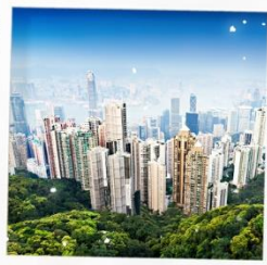
จุดชมวิวยาววิคตอเรีย