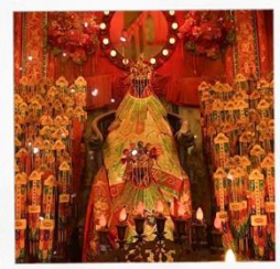
เจ้าแม่กวนอิมวัดสองฮ่า