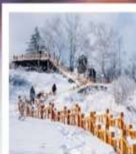
เขาเกาะหนัว

ทัวร์คุณภาพ ไม่ลงร้านช้อปปิ้ง • ไม่ขายออฟชั่น