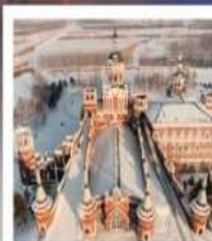
คฤหาสน์วอลการ์