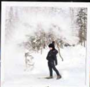
ภาพเขียน ICE AND SNOW