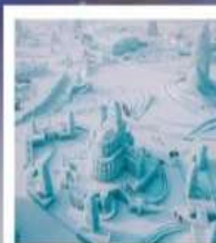
ICE AND SNOW FEST.