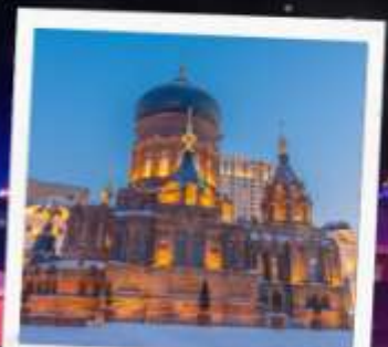
โบสถ์เซินโซเฟีย