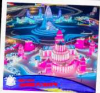
เทศกาลแกะสลักน้ำแข็ง