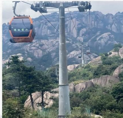
เขาลิงซาน