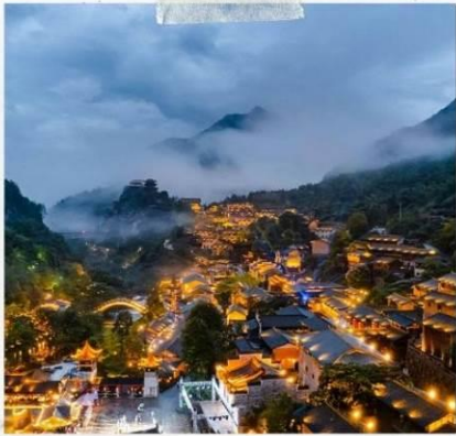
หุบเขาวังเซียนกู่