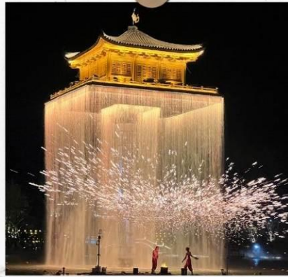
แสงไฟอุ๊นวิโจว