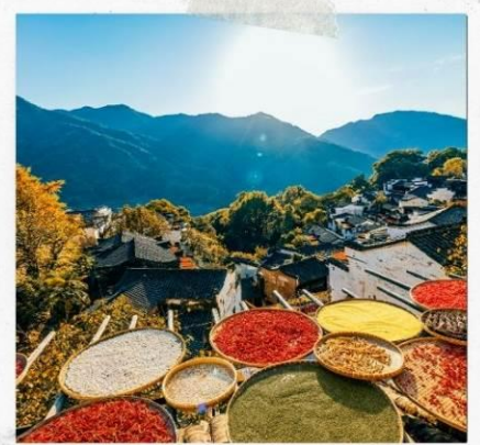
หมู่บ้านหวงลิ่ง