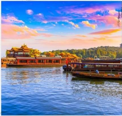
ทะเลสาบซีหู