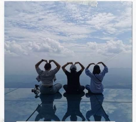
กระจกแห่งท้องฟ้า