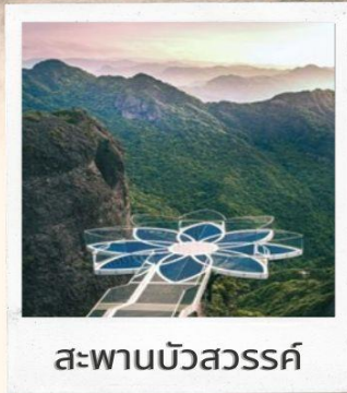
สะพานบัวสวรรค์