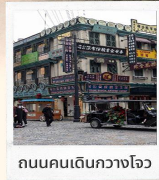
ถนนคนเดินกว้างโจว