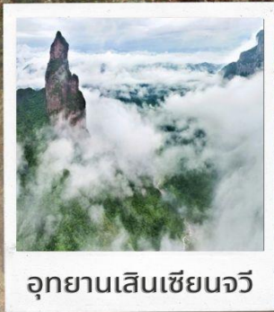
อุทยานเส้นเซียนจวี