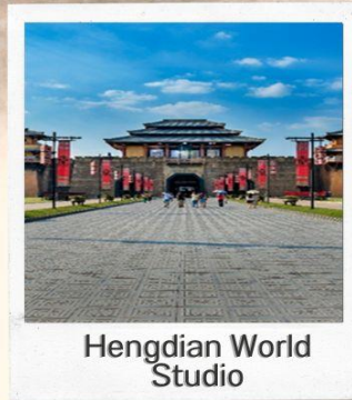
Hengdian World Studio