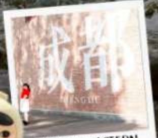
CHENGDU EASTERN MEMORY