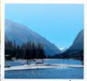
อุทยานชวงเฉียวโกว