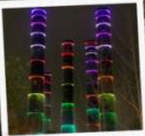
แสง สี ห้าง SKP