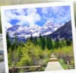
อุทยานภูเขาสี่ฤดู