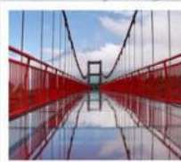
สะพานแก้วลี้เจียง