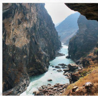
ช่องแคบเสือกระโดด