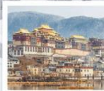
วัดลามะซงจันหลิน