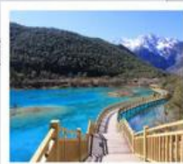
ไป๋สุ่ยเหอ