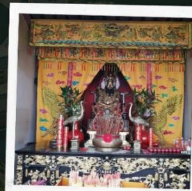
ศาลเจ้าเฮียงบู๊ซัว