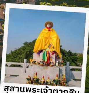
สุสานพระเจ้าตากสิน มหาราช