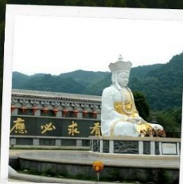
เทพเจ้าโจวซือกง