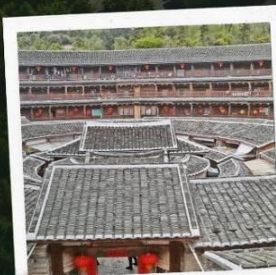
บ้านดินหย่งตั้ง