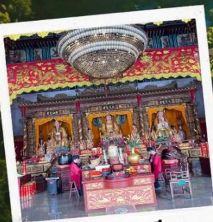
วัดแปะฮวยเจียม