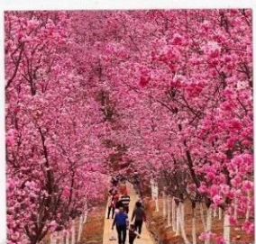
หุบเขาซากุระหมื่นลี