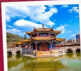
วัดหยวนทอง