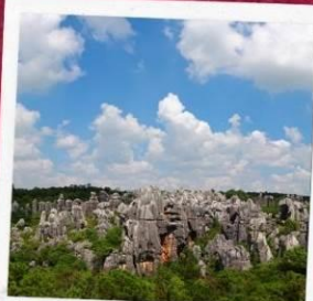
อุทยานป่าหิน