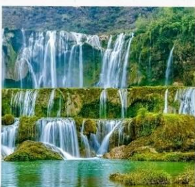
น้ำตกเก้ามังกร