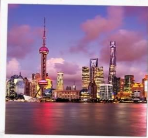
ชั้นหอไข่มุก