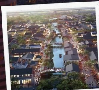
เมืองโบราณ ผานหลงกุ่เงิน