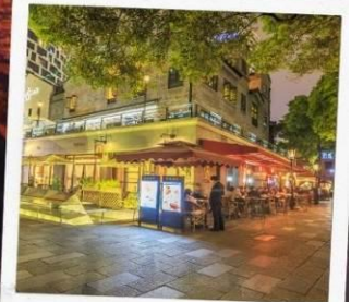
ย่านซินเทียนตี้