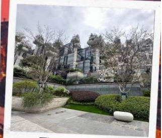
Tian An 1,000 Trees Square