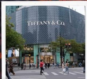
ถนนหวยไห่