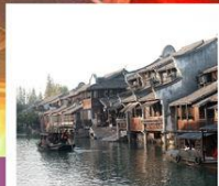
เมืองโบราณผานหลงกู่จิ้น