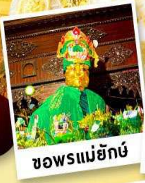
ขอพรแม่ยักย์