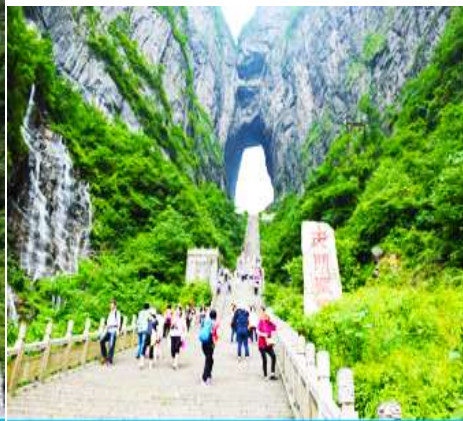
บันได 999 ขั้น