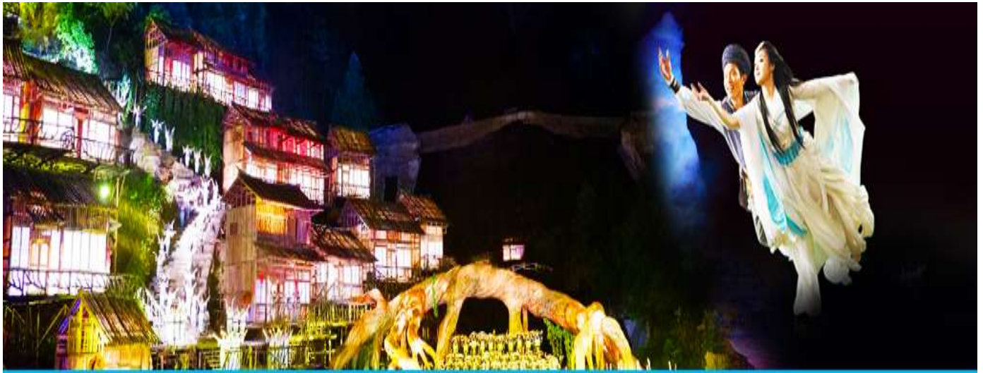
The Love Story of a Wooden Man and Fairy fox

อัตราค่าบริการสำหรับโปรแกรมเสริมการแสดงชุด The love Story of Wooden man and Fairy Fox ท่านละ 400 หยวน (หรือ 2,000 บาทขึ้นอยู่กับอัตราแลกเปลี่ยน)ระยะเวลาที่ใช้ในการเที่ยวชมการแสดง ประมาณ 3 ชั่วโมง รวมเวลาเดินทางไป กลับค่าบริการรวม ค่าบัตรเข้าชม ค่ารถรับ ส่ง และค่าน้ำดื่มของไกด์ท้องถิ่น พักที่ ZHENMIAN HOTEL โรงแรมระดับ 4 ดาวหรือเทียบเท่า