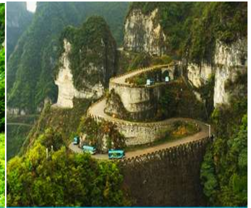
เส้นทาง 99 โค้ง

จากนั้นท่านสามารถทดสอบกำลังขาของท่านโดยการเดินลงบันได 999 ขั้น เพื่อลงมายังลานกว้างที่เป็นจุดถ่ายภาพด้านล่างของประตูสวรรค์ ท่านที่ไม่ต้องการเดินบันไดลง สามารถใช้บันไดเลื่อนแทนการเดินลงบันได 999 ขั้น ณ ลานกว้างด้านล่างเป็นจุดถ่ายภาพที่ดีที่สุดที่สามารถมองเห็นเขาประตูสวรรค์ได้อย่างชัดเจน จากนั้นนำท่านนั่งกระเช้าลงจากเขาเทียนเหมินซาน