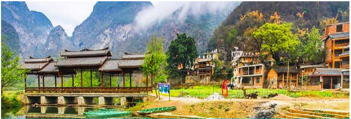
สวนดอกท้อ

จากนั้นนำท่านเที่ยวชม สวนดอกท้อ 世外桃源 เป็นสวนชมวิวที่ตั้งอยู่ริมแม่น้ำแยงซีเกียง มีจุดชมวิวม่านน้ำและมุ่มถ้ำรูปสวย ๆ หลายจุดภายในสวน ในช่วงฤดูใบไม้ผลิ (เดือนมีนาคม – เมษายน) ดอกท้อและดอกไม้อื่น ๆ จะบานสพรั่งแต่งแต้มสีสันให้สวนดอกท้อยิ่งขึ้น ให้ท่านถ่ายภาพ ณ มุมสวยและจุดชมวิวดังกล่าว ภายในสวน