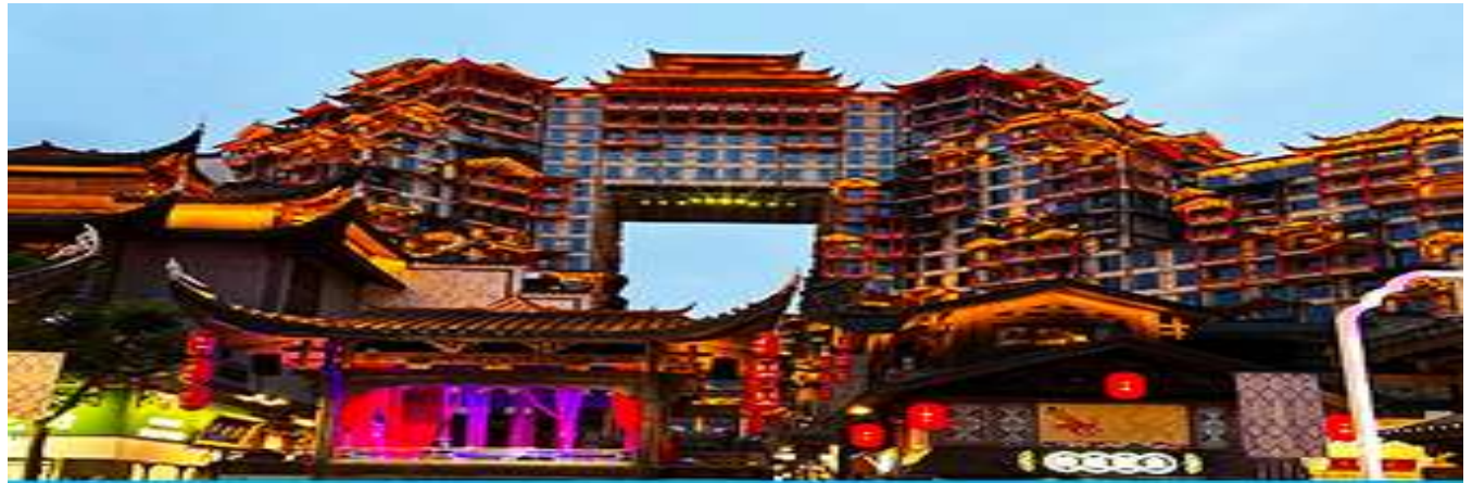
ตึกมหิศวรรษย์ 72 ชั้น