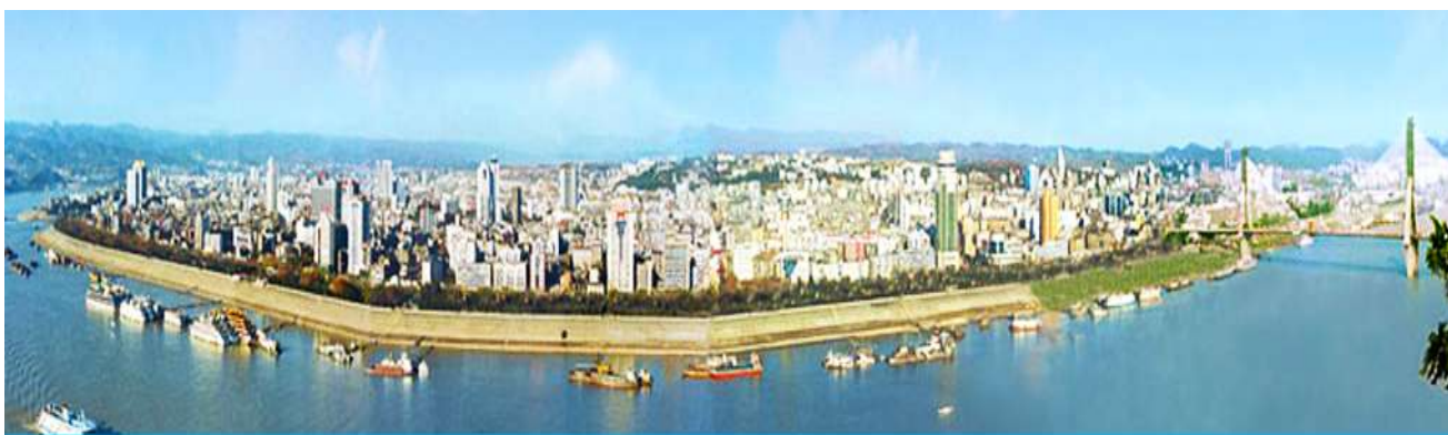
เมืองหยีชาง