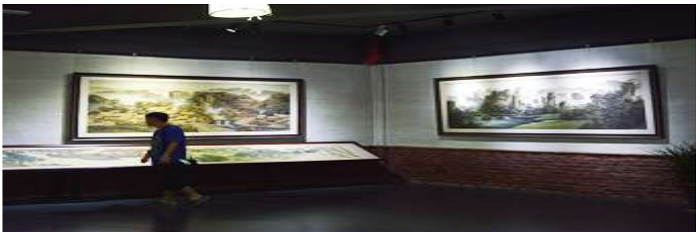
พิพิธภัณฑภาพหินทราย