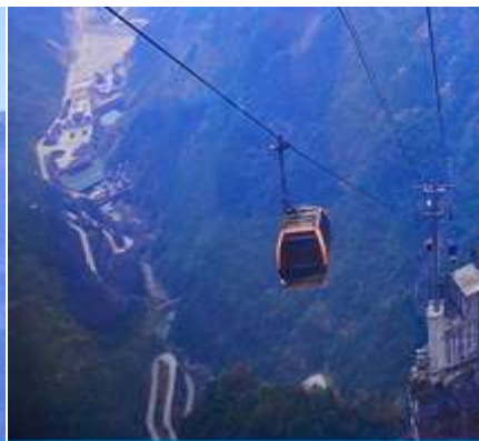
กระเช้าขึ้นเทียนเหมินซาน