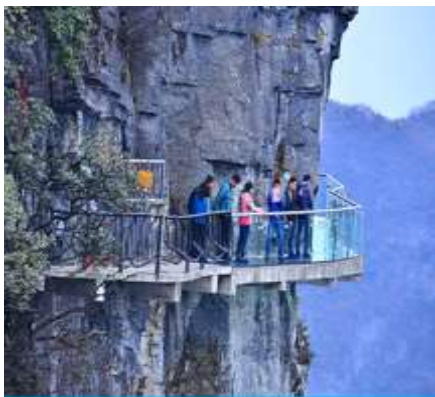
หน้าผาลอยฟ้ากาวเดินกระจก