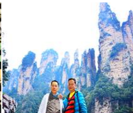
ชมจุดชมวิวลีฟท์แก้ว