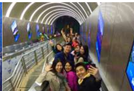
บันไดเลื่อนทะเลภูเขา