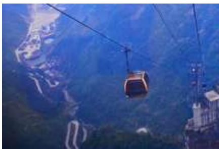
กระเช้าขึ้นเทียนเหมินซาน