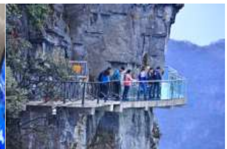
หน้าผาลอยฟ้าทางเดินกระจก