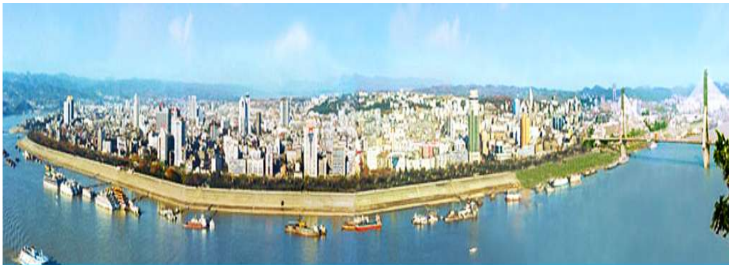
เมืองหยีซาง

ชมลึฟท์แก้วไปหลง 2. โชว์จิ้งจอกขาว โปรอ่านรายละเอียดในโปรแกรม