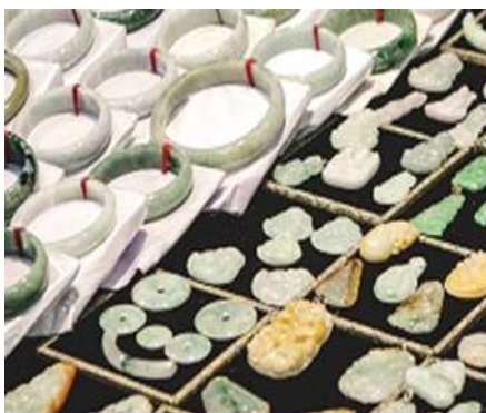
ศูนย์จำหน่ายผลิตภัณฑ์หยก

หลังอาหารเช้าให้ท่านพักผ่อนตามอัชฌาศัยในโรงแรม หรือท่านสามารถเลือกซื้อโปรแกรมเสริมซึ่งเป็นโปรแกรมท่องเที่ยวที่ไม่ได้รวมอยู่ในรายการท่องเที่ยว ได้แก่โปรแกรมเที่ยวอุทยานอวตาร ณ จุดชมวิวจินเปียนซี ลำธารเส้ามาทง นำท่านนั่งรถเข้าไปอุทยานขุนเขาอวตารจุดชมวิว ให้ท่านเก็บภาพแทนหินที่ตั้งตระหง่านระฟ้าอยู่เบื้องหน้า ที่ธรรมชาติได้สร้างสรรค์ความอัศจรรย์ของแทนหินในอุทยานอวตารแห่งนี้ จากนั้นนำท่านนั่งรถอุทยานเดินทางต่อไปยังจุดชมวิวลีฟท์แก้วไปหลงให้ท่านได้เก็บภาพลิฟท์แก้วไปหลง ลิฟท์แก้วที่ได้ชื่อว่าลิฟท์ติดหน้าผาที่สูงสุด 326 เมตรให้ท่านเก็บภาพแทนหินสูงระฟ้าตรงจุดชมวิวลีฟท์แก้วไปหลง จากนั้นนำท่านนั่งรถออกจากอุทยานขุนเขาอวตาร