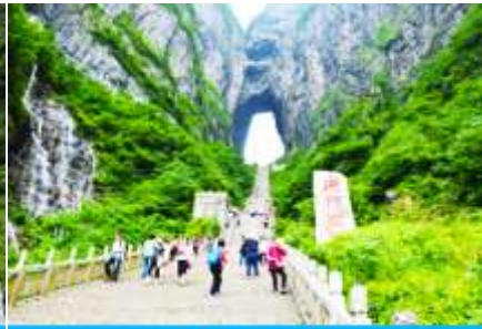
บันได 999 ขั้น