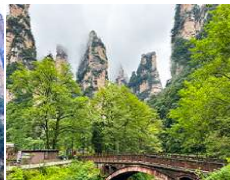
จุดชมวิวจินเปียนซี