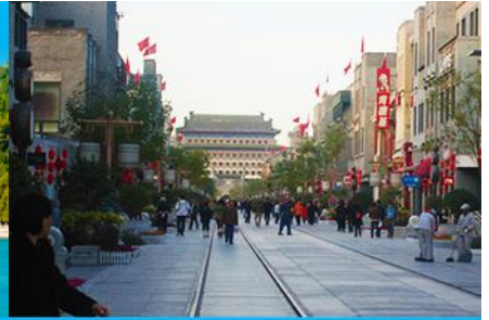
ถนนเทียนเหมิน