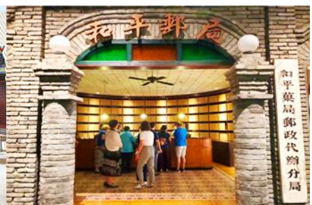
เมืองโบราณจำลอง