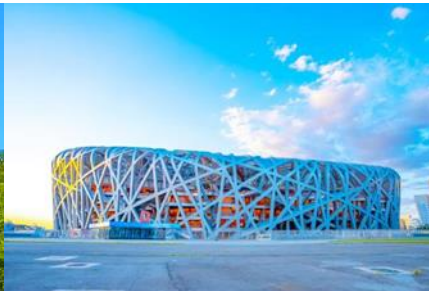
สนามกีฬาโอลิมปิก