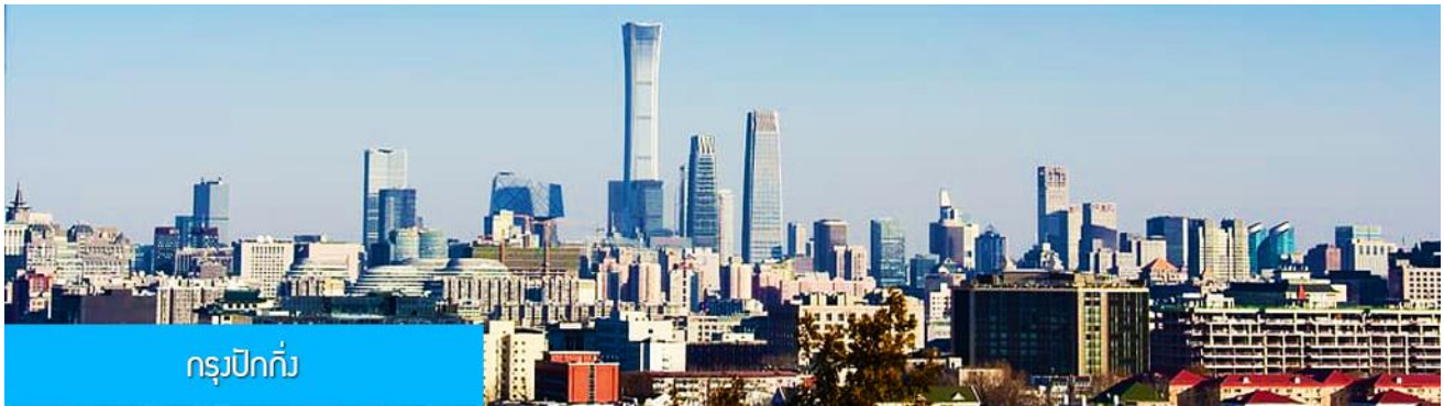
กรุงปักกิ่ง