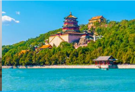
พระราชวังฤดูร้อนหยี่เหอหยวน