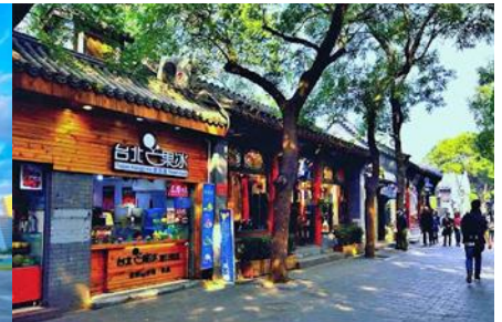
ชอยหนานหลัวกู่เซียง

วันที่สาม กำแพงเมืองจีนด่านฉีหยกวน – ศูนย์จำหน่ายหยก-สนามกีฬารังนก(ชมด้านนอก) - ชอยหนานหลัวกู่เซียง (B/L/D)