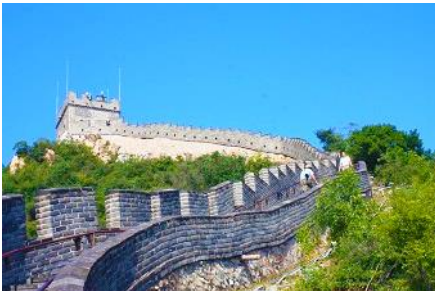
กำแพงเมืองจีนด่านฉีหยกวน

พักที่ JINGLIN HTL OR HOLIDAY INN EXPRESS HTL 4* หรือ โรงแรมในระดับเดียวกันในกรุงปักกิ่ง