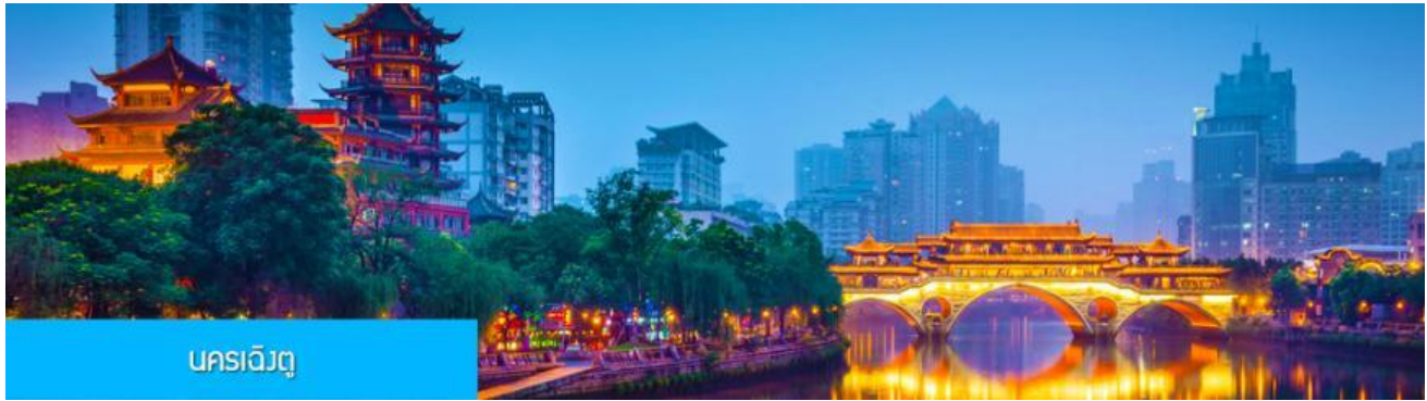
นครเฉิงตู