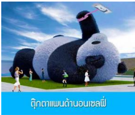
ตุ๊กตาแพนด้าอนเซลฟี

พักที่ DAGU GLACIER HOTEL 4* หรือ โรงแรมระดับเดียวกันพื้นเมือง