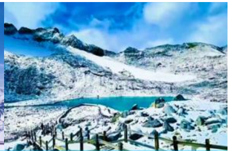
ทะเลสาบต้ากู่

วันที่ 1 เมืองเหยสู่ย-อุทยานภูเขาหิมะการ์เซียต้ากู่ปิงชว่น (รวมค่ากระเช้าขึ้น-ลง) - รถเมล์ในอุทยาน- เหยสู่ย (B/L/D)