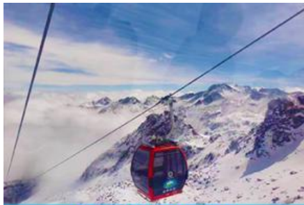
นั่งกระเช้าสู่อุทยานสวรรค์ ภูเขาคิมะการ์เซียต้ากู่

พักที่ YARI INTER HOTEL 4* หรือ โรงแรมระดับเดียวกันท้องถิ่น