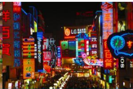
ถนนคนเดินซุนซีลู่

วันที่หก เมืองเฉิงตู –ถนนไท่กู่หลี่-วัดต้าเจี๋ย-POP MART -ช้อปปิ้งถนนซุนซีลู่ -เดินทางกลับกรุงเทพฯ-สุวรรณภูมิ (B/L/D)