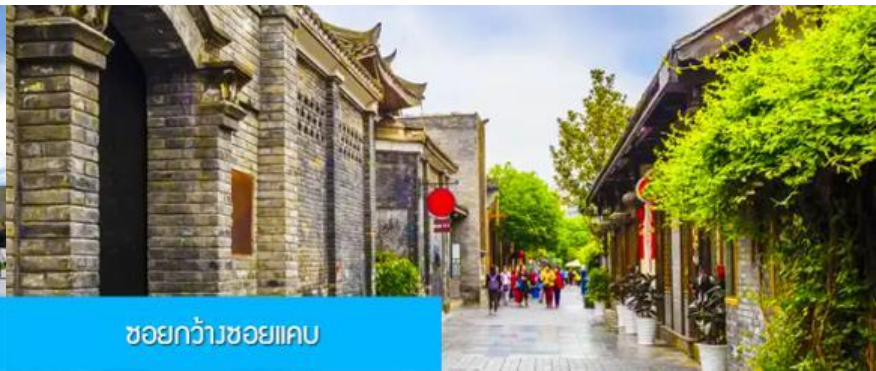
ชอยกว้างชอยแคบ

วันที่ห้า เหอสู่ย-ตุ๊กตาหมีอนเซลฟี-ชอยกว้างชอยแคบชอยกว้าง- ช้อปปิ้งสินค้าพื้นเมือง ลานบู๊ (B/L/D)