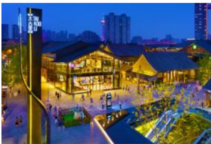
ถนนไท่กู่หลี่ และวัดต้าเจี๋ย

พักที่ โรงแรม SERENGETI HOTEL ระดับ4 ดาวห้องถื่นหรือเทียบเท่า