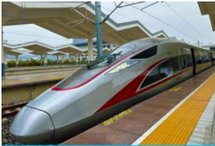
นิ้รกอไฟความเร็วสูง