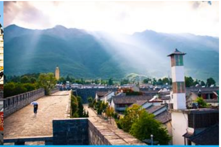
หมู่บ้านซีโจว(หมู่บ้านชาวปู้)