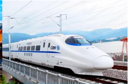
มังกรไฟความเร็วสูง

วันแรก กรุงเทพฯ-ดอนเมือง-คุนหมิง--นั่งรถไฟความเร็วสูงสู่เมืองต้าลี่