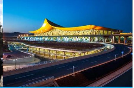
สนามบินเมืองคุนหมิง