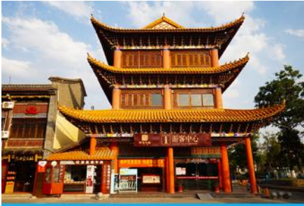
เมืองโบราณกวนตุ๋

NiceTripExcursion / ทิวทัศน์ไทม์ลคราคา / ทิวทัศน์ทิวทัศน์