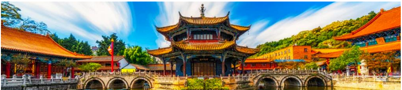
วัดหยวนกวาง