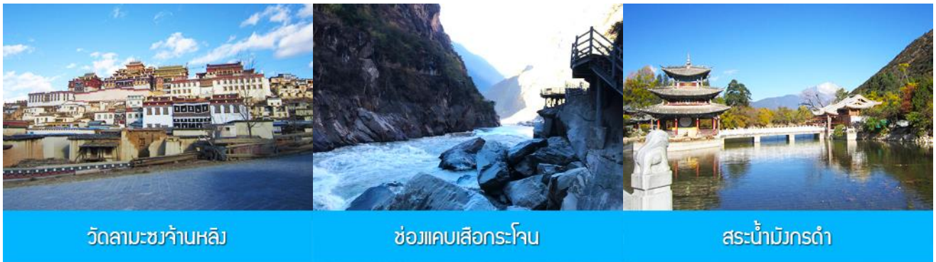
วัดลามะซงจ้านหลิง