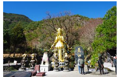
อุทยานน้ำหยก