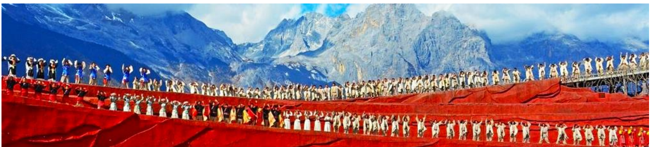
การแสดง IMPRESSION LIJIANG

หลังอาหารนำท่านชมการแสดง IMPRESSION LIJIANG โชว์อันยิ่งใหญ่โดยผู้กำกับชื่อดังของโลก “จาง อี้โหมว” ได้เนรมิต ให้ภูเขาหิมะมังกรหยกเป็นฉากหลัง และบริเวณทุ่งหญ้าเป็นเวทีการแสดง โดยใช้นักแสดงกว่า 600 ชีวิต แสง สี เสียง การแต่งกายตระการตาเล่าเรื่องราวชีวิตความเป็นอยู่ และชาวเผ่าต่างๆ ของเมืองลี่เจียง