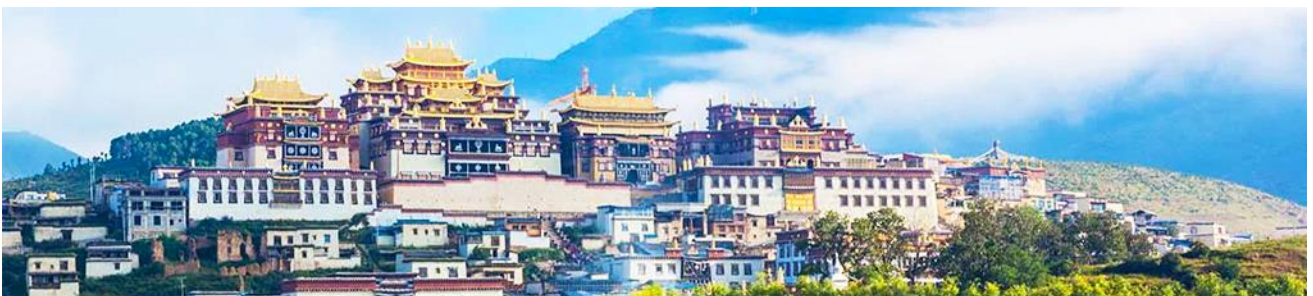
เมืองโบราณเซงกรีล่า

จากนั้นนำท่านชม หมู่บ้านซีโจวหรือหมู่บ้านชาวปู้ ชนพื้นเมืองที่สำคัญของเมือง ชมการแสดงของชนชาติป้อพร้อมชิมชาสามแก้ว เพื่อรำลึกถึงวิถีชีวิตและการเกิดมาเป็นมนุษย์ของตนเอง ซึ่งถือเป็นเอกลักษณ์ของชนชาวปู้ ที่หาดูได้ยาก