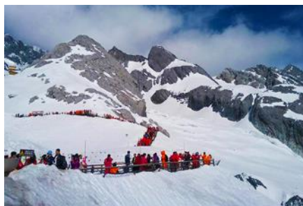
ภูเขาหิมะมังกรหยก