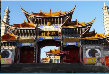
วัดเจ้าแม่กวนอิมแปลงกาย