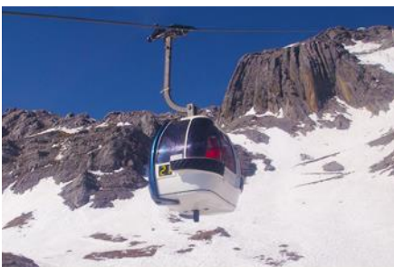
ภูเขาหิมะมังกรหยก (บึงกระซำใหญ่)