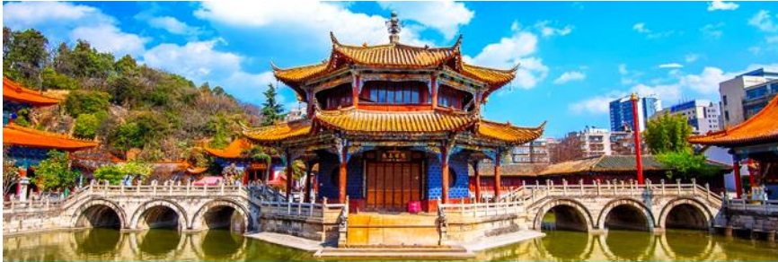
วัดหยวนกวาง