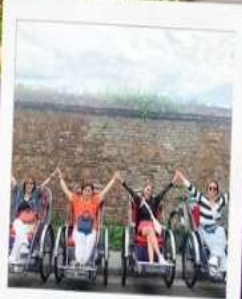
รถสามล้อ Cyclo