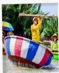
เรือกระด้ง