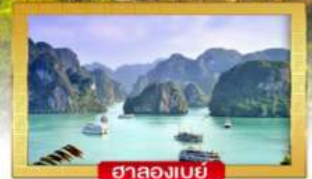
ฮาลองเบย์