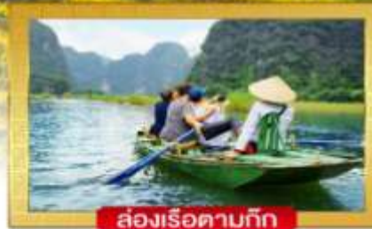
ล่องเรือตามก๊ก