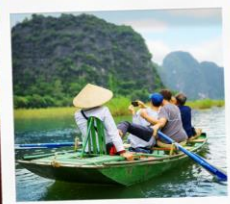
ล่องเรือ Tamcoc