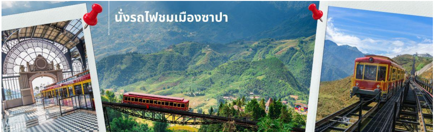
นั่งรถไฟชมเมืองซาปา

นำท่าน นั่งรถไฟชมเมืองซาปา (รวมค่ารถไฟชมเมือง) ท่านจะได้พบกับวิวทิวทัศน์ของเมืองซาปาที่เต็มไปด้วยความสดชื่น และสุดกลิ่นอายธรรมชาติ และยังตื่นตาไปด้วยวิวภูเขา และนาขั้นบันได ที่มีชื่อเสียงของเมืองซาปาอีกด้วย ความยาวประมาณ 2 กิโลเมตร โดยใช้เวลาประมาณ 20 นาทีเพื่อไปสู่สถานีขึ้นกระเช้าที่จะนำท่านขึ้นสู่ยอดเขาฟานซีปัน