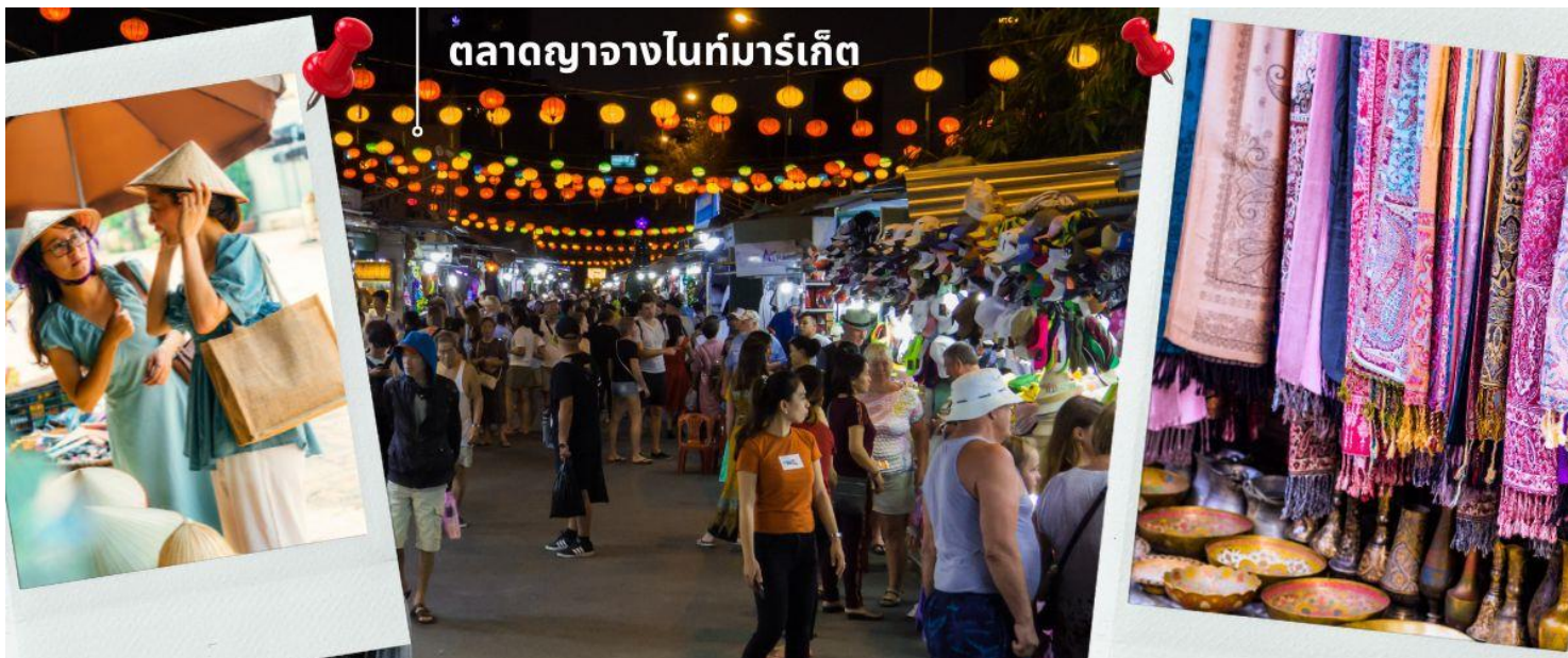
ตลาดญากวางไนท์มาร์เก็ต

ให้ท่านได้อิสระในการเดินเที่ยว และเลือกซื้อของฝากที่ ตลาดญากวางไนท์มาร์เก็ต ตั้งอยู่ใจกลางเมืองญากวาง ไม่ห่างจากชายหาดมากนัก ที่นี่เป็นตลาดขนาดเล็กที่เกิดจากการปิดถนน ให้นักท่องเที่ยวได้เดินเล่น และเลือกซื้อของฝากของที่ระลึก จนกลายเป็นแหล่งรวมนักท่องเที่ยว และวัยรุ่นในเมืองญากวาง ออกมาเดินเที่ยว และเลือกซื้อสินค้า กันอย่างคึกคัก