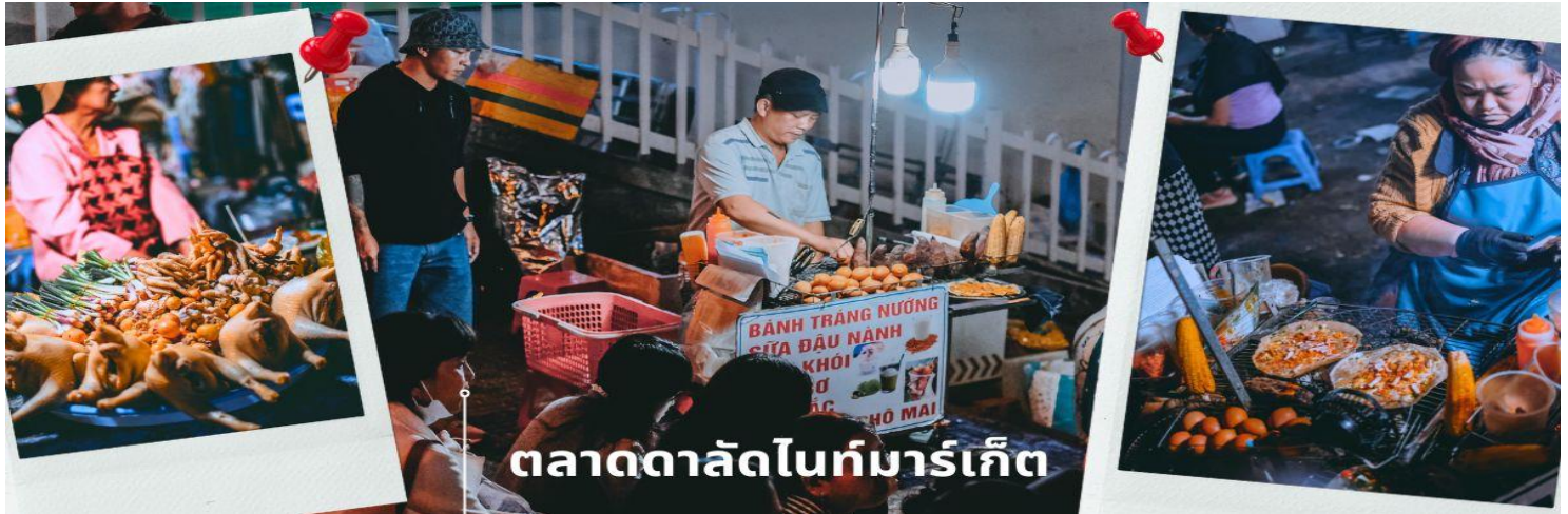
ตลาดดาลัดไนท์มาร์เก็ต

ตื่นตาไปกับ ตลาดดาลัดไนท์มาร์เก็ต หรือถนนคนเดินเมืองดาลัด ตั้งอยู่ใจกลางเมืองดาลัด ตลาดเปิดทุกวัน เวลา 18:00-00:00 มีความเป็น Local ของกินราคาถูก มีร้านขายเสื้อผ้ากันหนาวสวยๆ ราคาไม่แพงหลายร้าน มีของซีฟู้ด และร้านหม้อไฟ และสินค้าอื่นๆ อีกมากมาย