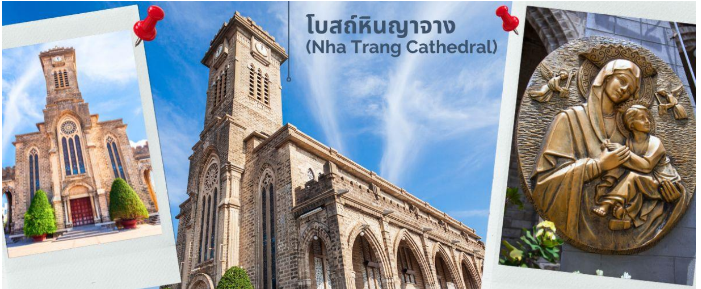
โบสถ์หินญากวาง (Nha Trang Cathedral)

พาท่านชม โบสถ์หินญากวาง (Nha Trang Cathedral) เป็นโบสถ์ที่ใหญ่ที่สุดในเมืองญากวาง ตั้งโดดเด่นอยู่บนเนินสูง 10 เมตร ห่างจากทะเลเพียงแค่ว่า 1 กิโลเมตร โบสถ์หลังนี้ถูกสร้างขึ้นในสไตล์ฝรั่งเศสโกธิก ภายในโบสถ์ถูกตกแต่งด้วยกระจกสีที่มีสีสันสวยงาม พื้นที่ภายในโบสถ์จะมี 760 ตร.กม. สามารถบรรจุคนได้ถึง 600 คน ตัวโบสถ์ถูกสร้างด้วยบล็อกซีเมนต์ และใช้หินในการปูพื้น