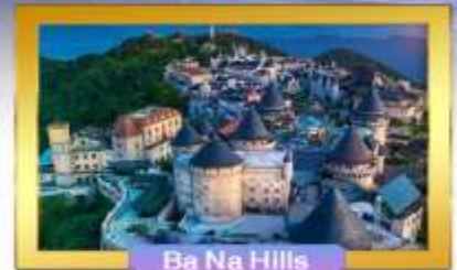
Ba Na Hills