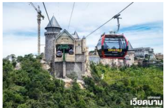
บันทึกจรรยา เวียดนาม คาบิง • ต๋อยอิ่น • บานาฮิลล์

นั่งกระเช้าขึ้นสู่บานาฮิลล์ กระเช้าแห่งบานาฮิลล์นี้ได้รับการบันทึกสถิติโลกโดย World Record ว่าเป็นกระเช้าไฟฟ้าที่ยาวที่สุดประเภท Non Stop โดยไม่หยุดแะมีความยาวทั้งสิ้น 5,042 เมตรและเป็นกระเช้าที่สูงที่สุดที่ 1,294 เมตรนักท่องเที่ยวจะได้สัมผัสบรรยากาศเมฆหมอกและบางจุดมีเมฆลอยต่ำกว่ากระเช้าพร้อมอากาศบริสุทธิ์อันสดชื่นจนทำให้ท่านอาจลืมไปเสียด้วยซ้ำว่าที่นี่ไม่ใช่ยุโรปเพราะอากาศที่หนาวเย็นเฉลี่ยตลอดทั้งปีประมาณ 10 องศาเท่านั้นจุดที่สูงที่สุดของบานาฮิลล์มีความสูง 1,467 เมตรกับสภาพผืนป่าที่อุดมสมบูรณ์ นำท่านชม สะพานสีทอง สถานที่ท่องเที่ยวใหม่ล่าสุดตั้งโดดเด่นเป็นเอกลักษณ์อย่างสวยงาม บนเขาบานาฮิลล์