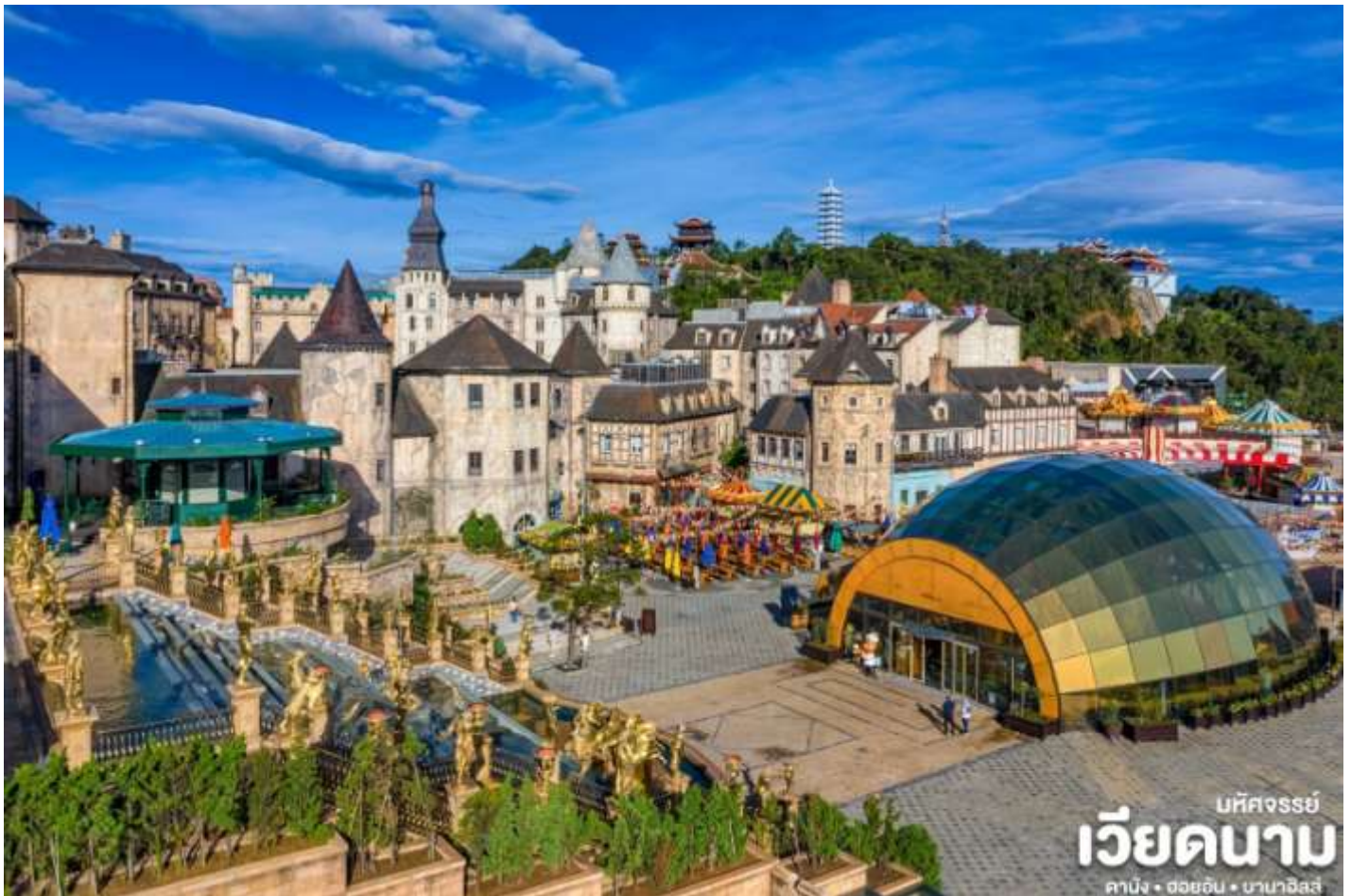
บันทึกจรรยา เวียดนาม คาบิง • ต๋อยอิ่น • บานาฮิลล์