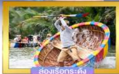
ส่องเรือกระดังง์