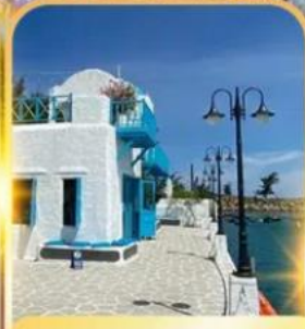
SON TRA MARINA CAFE