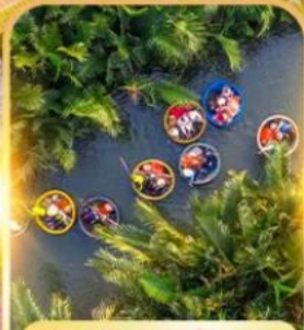
เรือกระดิ่ง