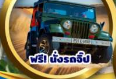
ฟรี! นั่งรถจี๊ป