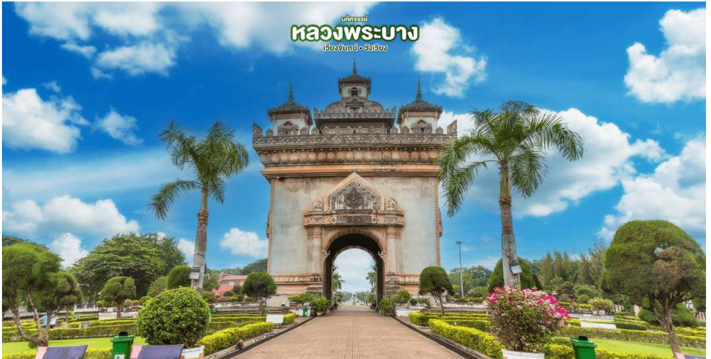
บริษัทจรรยา หลวงพระบาง เวียงจันทน์ • อังเวียง