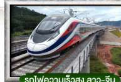
รถไฟความเร็วสูง ลาว-จีน