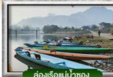
ท่องเที่ยวแม่น้ำโขง