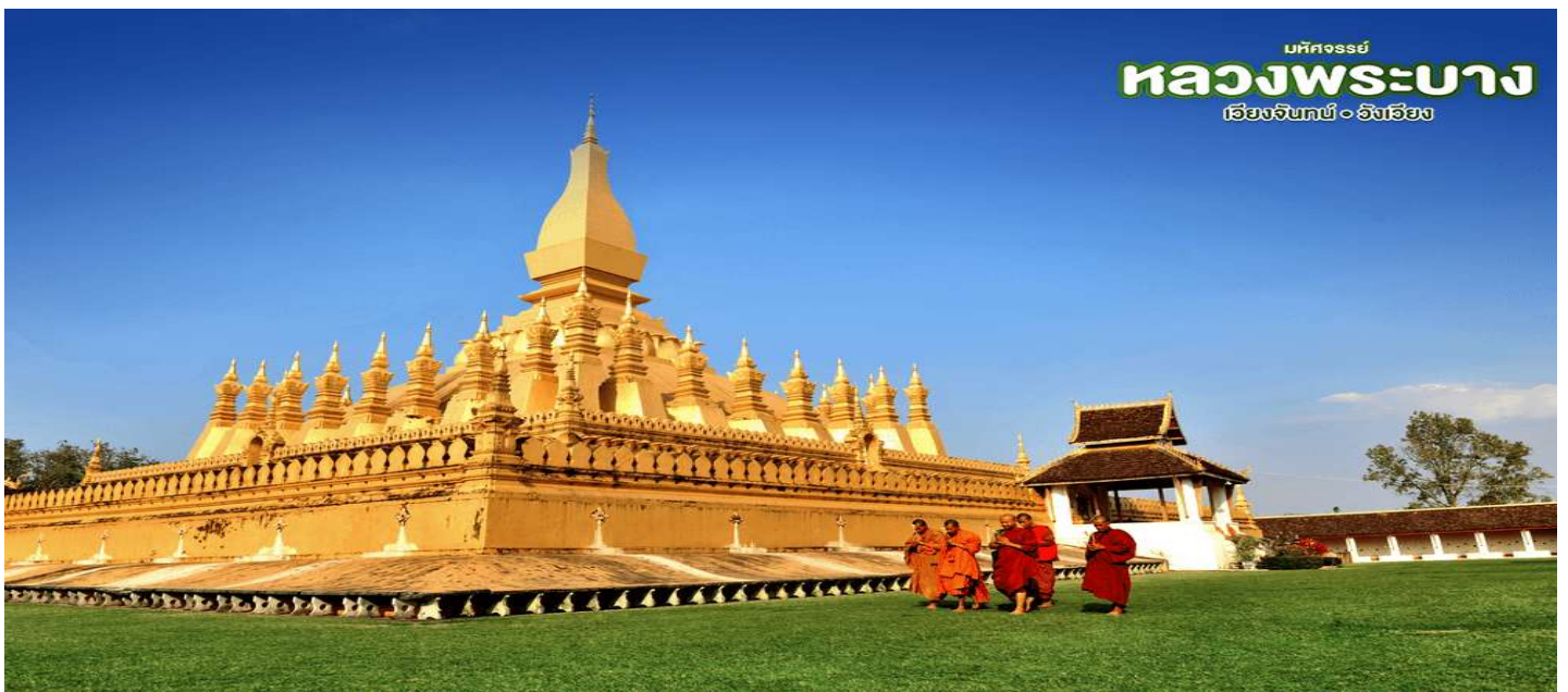
บริษัทจรรยา หลวงพระบาง เวียงจันทน์ • อังเวียง

สักการะ วัดพระธาตุหลวง(THATLUANG PAGODA) เป็นเจดีย์ที่มีลักษณะโดดเด่นที่สุดในอาณาจักรล้านช้างเป็นการผสมผสานระหว่างสถาปัตยกรรมในพระพุทธศาสนากับสถาปัตยกรรมของอาณาจักรมีลักษณะคล้ายป้อมปราการมีการก่อสร้างระเบียงสูงใหญ่ขึ้นโอบล้อมองค์พระธาตุไว้พร้อมกับทำช่องหน้าต่างเล็กๆเอาไว้โดยตลอดประตูทางเข้าเป็นบานประตูไม้ใหญ่ลงรักสีแดงรอบๆองค์พระธาตุยังมีเจดีย์บริวารล้อมอยู่โดยรอบจากนั้น นำท่านเลือกชม ร้านหัตถกรรม เครื่องเงิน