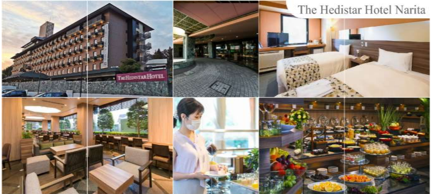
พักที่ THE HEDISTAR HOTEL NARITA หรือระดับเดียวกัน

ได้เวลาอันสมควรนำท่านเดินทางสู่เมืองนาริตะ (ใช้เวลาเดินทางประมาณ 1 ชั่วโมง)