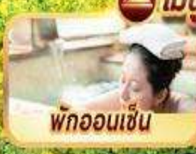
พักผ่อนเซ็น