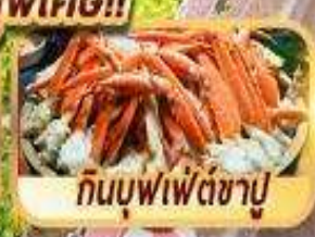
กินซาบูฟุฟุเพ็ดซาบู