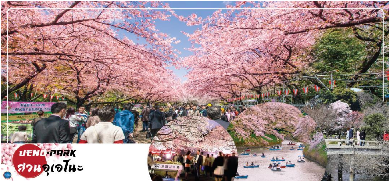
UENO PARK สวนอุเอโนะ