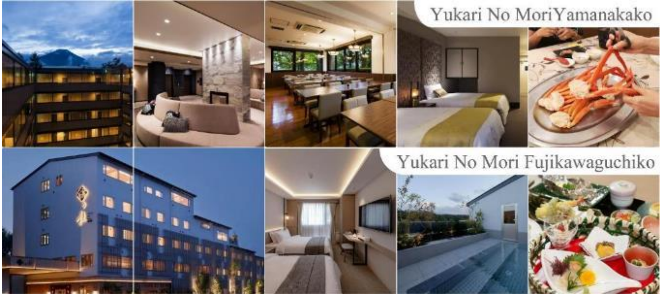
Yukari No Mori Yamanakako

หลังอาหารให้ท่านได้ผ่อนคลายกับการแช่น้ำแร่ธรรมชาติ เชื่อว่าถ้าได้แช่น้ำแร่แล้ว จะทำให้ผิวพรรณสวยงามและช่วยให้ระบบหมุนเวียนโลหิตดีขึ้น