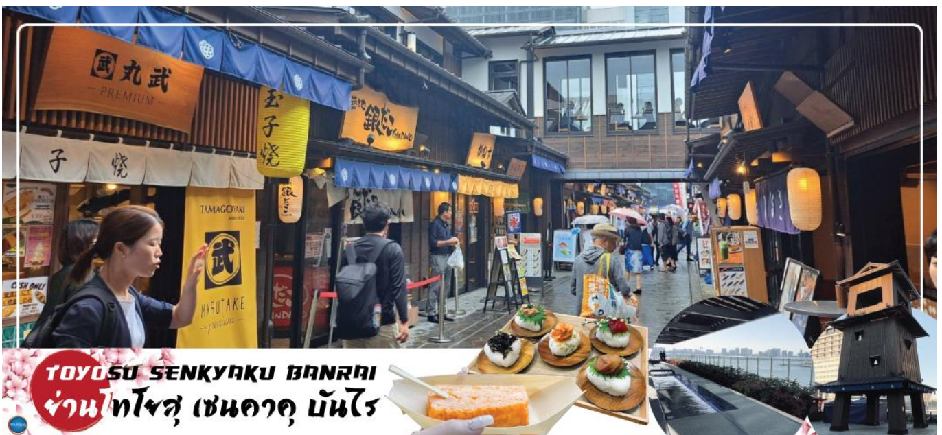
TOYOSU SENKYAKU BANRAI ย่านโทโยสุ เซนคาคุ บันไร

จากนั้นนำท่านสู่ ย่านโทโยสุ เซนคาคุ บันไร (Toyosu Senkyaku Banrai) (ใช้เวลาเดินทางประมาณ 25 นาที) เป็นสถานที่ท่องเที่ยวใหม่ที่ตั้งอยู่ในย่าน Toyosu ของ Tokyo ที่เป็นเหมือนตลาดในธีมย้อนยุคสมัยเอโดะ เปิดให้บริการในวันที่ 1 กุมภาพันธ์ 2024 โดยมีทั้งตลาด อาหาร และสถานบันเทิง นอกจากนี้ยังมีออนเซ็น 24 ชั่วโมงที่ช่วยให้เราผ่อนคลายอีกด้วย เป็นตลาดที่มีทั้งอาหารทะเลสดใหม่จาก Toyosu Market และอาหารญี่ปุ่นหลากหลายชนิด เช่น ซูชิ เทมปุระ และราเมน ที่นี้