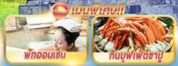
พทอนเซ็น