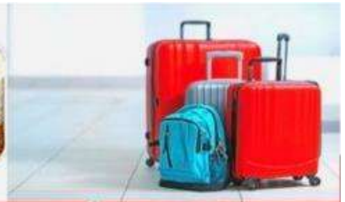
น้ำหนักกระเป๋า สูงสุด 20 กก.

กรุณาปรับนาฬิกาของท่านเป็นเวลาท้องถิ่นเพื่อสะดวกในการนัดหมาย)