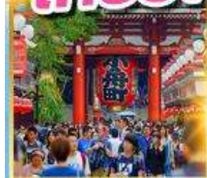
วัดอาซากุสะ