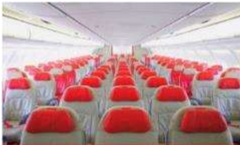
เครื่องลำใหญ่ 377 ที่นั่ง

*** หมายเหตุ : เคาน์เตอร์เช็คอินปิดบริการก่อนเวลาเครื่องออก 60 นาที และไม่มีประกาศเตือนผู้โดยสารขึ้นเครื่อง ดังนั้นผู้โดยสารจำเป็นต้องพร้อม ณ ประตูขึ้นเครื่องก่อนเวลาเครื่องออกอย่างน้อย 45 นาที *** สายการบิน AIR ASIA X ใช้เครื่อง AIRBUS A330-300 จำนวน 377 ที่นั่ง จัดที่นั่งแบบ 3-3-3 ตัวเครื่องบินเป็นตักรูปสำหรับคนพิการ ระบบของสายการบินจะทำการแรนดอมที่นั่ง ซึ่งไม่สามารถเลือกหรือเลือกที่นั่งได้ หากลูกค้าต้องการเลือกที่นั่ง ทางสายการบินมีบริการอัปเกรดที่นั่ง (ค่าบริการเป็นไปตามที่สายการบินกำหนด)