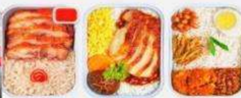
บริการอาหารร้อน ทั้งขาไป-ขากลับ