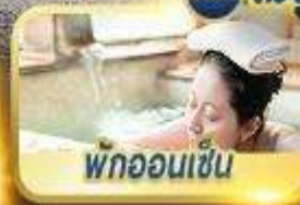
พักผ่อนเซ็น