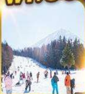
ลานสกีฟูจิเท็น