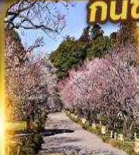
สวนไคราคูเอิน