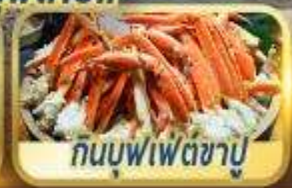
กินบุฟเฟ่ต์ชาบู