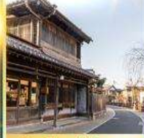
ย่านเมืองเก่าซาวาระ