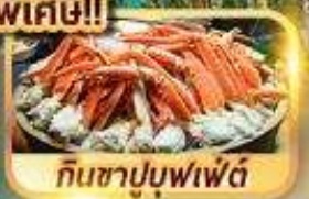
กินซาบุมบุฟเฟ่ต์