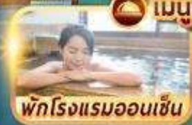
พักโรงแรมออนเซ็น