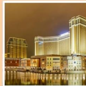
เดอะเวเนเซียน

จุดชมฟูจิกกลางสวนสนุกที่ไม่เหมือนใคร บนฟูจิยามะ สกายเด็ก โตเกียวดิสนีย์แลนด์ สวนสนุกในฝันของทุกคนในครอบครัว สักการะ อุชิคุไดบุทสึ องค์พระใหญ่ที่สุดของประเทศญี่ปุ่น เปลี่ยนบรรยากาศนั่งรถไฟริมทะเลสุดคลาสสิก ในเมืองคามาคูระ กราบไหว้ขอพรกับเทพเจ้าองค์ไต่ส่วยเอี้ย วัดเปากง สัมผัสความอลังการของ เดอะเวเนเซียน รีสอร์ทระดับเวิลด์คลาส พักออนเซ็น 1 คืน!!! // อาหาร : บุฟเฟ่ต์ชาบูยักษ์, บุฟเฟ่ต์ชาบู กรุ๊ปสบายๆ เพียง 20-25 ท่านเท่านั้น!!!