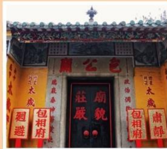
วัดเปากง