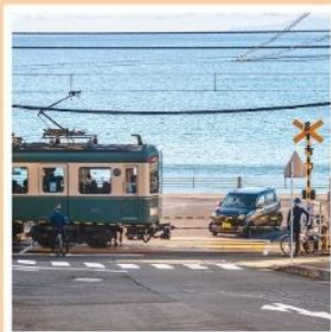
รถไฟโอโมะเด็ง