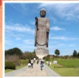
พระพุทธรูปอุชิคุไดบุทสึ