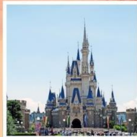
โตเกียว ดิสนีย์แลนด์