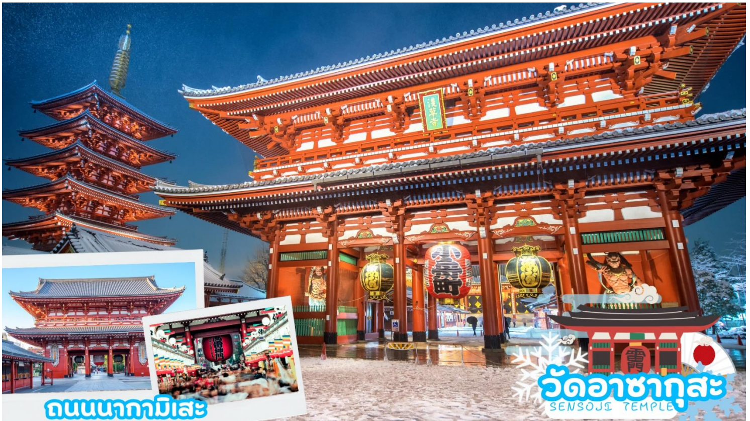
ถนนนากามิสะ

กลางวัน รับประทานอาหารกลางวัน ณ ร้านอาหาร (มื้อที่ 1)