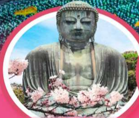
หลวงพ่อดังโตโดบุตสึ