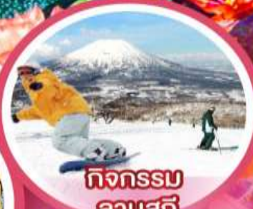
กิจกรรม ลานสกี