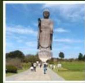
พระพุทธรูปอุชิคุโดบุทสึ