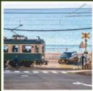
รถไฟเอโนะเด็ง