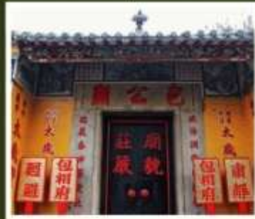
วัดเปากง