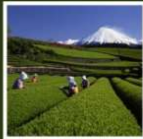
ไร่ชาโอบุจิชะชะบะ