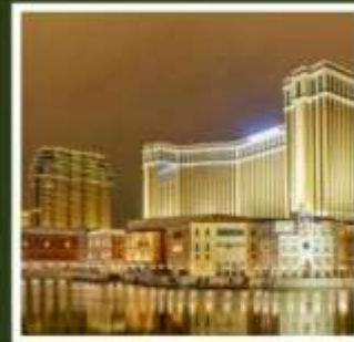
เดอะ เวเนเชียน

ฟูจิยามะ ทาวเวอร์ ขึ้นชมฟูจิจากสวนสนุกที่ไม่เหมือนใคร ชมไร่ชาโอบุจิชะชะบะ อันเลื่องชื่อ