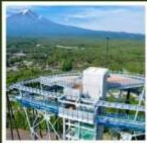
ฟูจิยามะ ทาวเวอร์