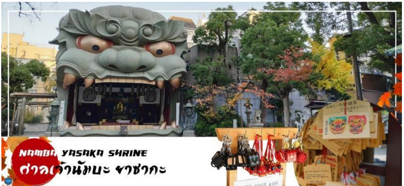
NAMBA YASAKA SHRINE

ตั้งอยู่ในย่านนัมบะของเมืองโอซาก้า ไฮไลท์ของศาลเจ้าแห่งนี้ คือรูปปั้นหน้าสิงโตอ้าปากขนาดใหญ่ ที่เชื่อกันว่า สามารถกลืนกินปีศาจร้าย หรือ สิ่งไม่ดีทั้งหลาย ให้หายไป และนำพามาซึ่งความโชคดีให้แก่ผู้คน ปัจจุบันนักเรียน นักศึกษา และผู้ประกอบการธุรกิจนั้น นิยมมาขอพรให้ประสบความสำเร็จกันที่นี่ ด้วยความสูง 17 เมตร ความกว้าง 11 เมตรและความลึก 7 เมตร อีสระให้ทุกท่านสักการะ และเก็บภาพที่ ศาลเจ้านัมบะ ยะซะกะ