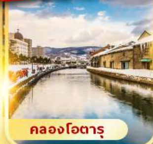
คลองโอตารุ