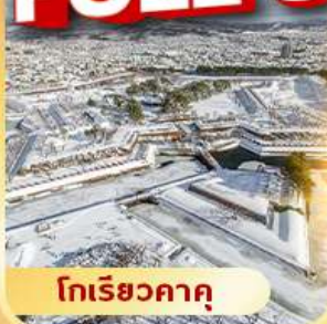
โทริเยวคาคุ