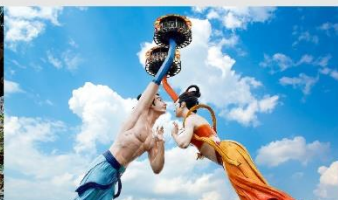
Wulong Flying Kiss