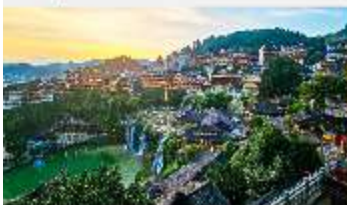
เมืองโบราณฝูหลงเจิน