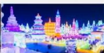
เทศกาลคอมไฟน้ำแข็ง