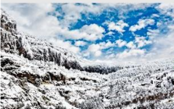
ภูเขาหิมะเจียวจื่อ