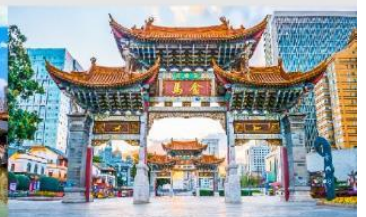
ประตูม้าทอง ไก่อหยก

*ทางบริษัทฯ ขอสงวนสิทธิ์ในการสลับโปรแกรมทัวร์ตามความเหมาะสมขึ้นอยู่กับสถานการณ์หน้างาน โดยคำนึงถึงผลประโยชน์ของลูกค้าเป็นสำคัญ