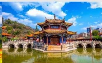
วัดหยวนตง