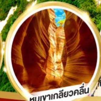
หุบเขาเกลียวคลื่น