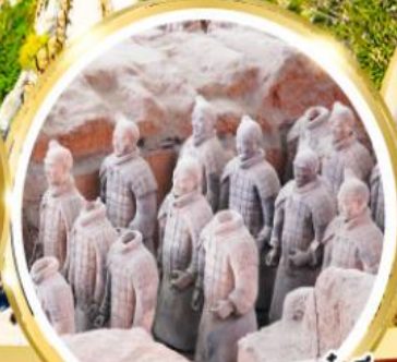
กองทัพทหารดินเผาจีนซี