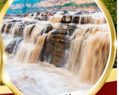
น้ำตกหูโง่ว