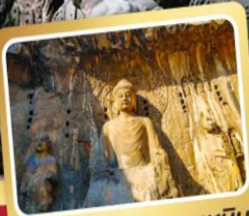
พิพิธภัณฑ์หลุมฝังศพ