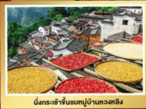
มังกรระชาจีนชมหมู่บ้านหวงหลิง