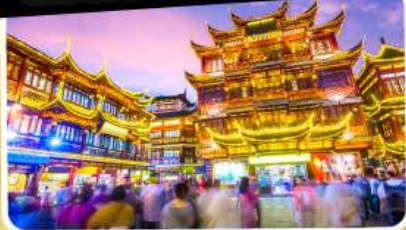
ตลาดร้อยปีเจิ้งหวังเมี่ยว