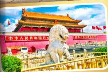
จตุรัสเทียนอันเหมิน