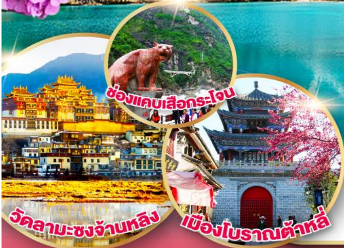
ช่องแคบเสีอกระโจน